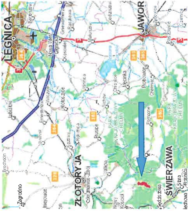
Lokalizacja obszaru 1:250 000

11. Adnotacje o inspekcjach, informacje o zmianach (daty, imiona i nazwiska wypełniających)