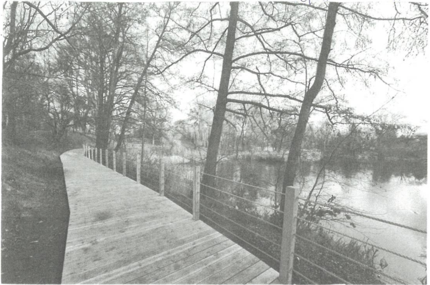
Trakty drewniane w Parku Pawłowickim - Włocławek 2020v.