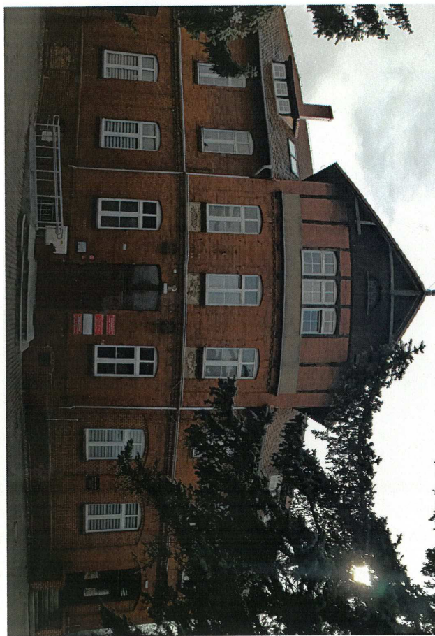
Zdjęcie: Fasada północno-zachodnia

Skala 1:7500