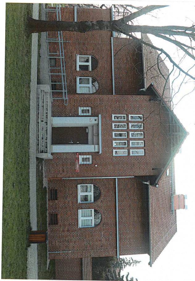
Zdjęcie: Fasada północno-wschodnia

Skala 1:7500