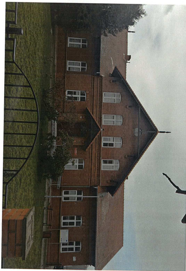
Zdjęcie: Fasada północno-wschodnia

Skala 1:7500