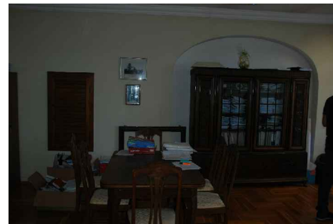
POMIESZCZENIE BIUROWE - I PIĘTRO