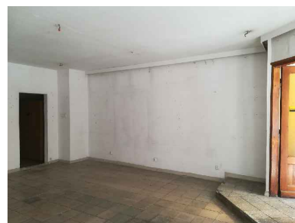
POMIESZCZENIE DAWNEGO ANTYKWARIATU

WSZYSTKIE WYMIARY SPRAWDZIĆ NA BUDOWIE Zastrzeżenie wszelkie prawa wynikające z ustawy o prawie autorskim.