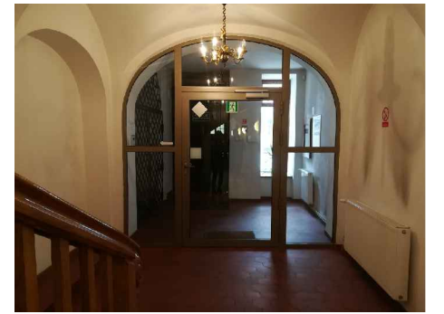
KORYTARZ - WIATROŁAP, KOMUNIKACJA