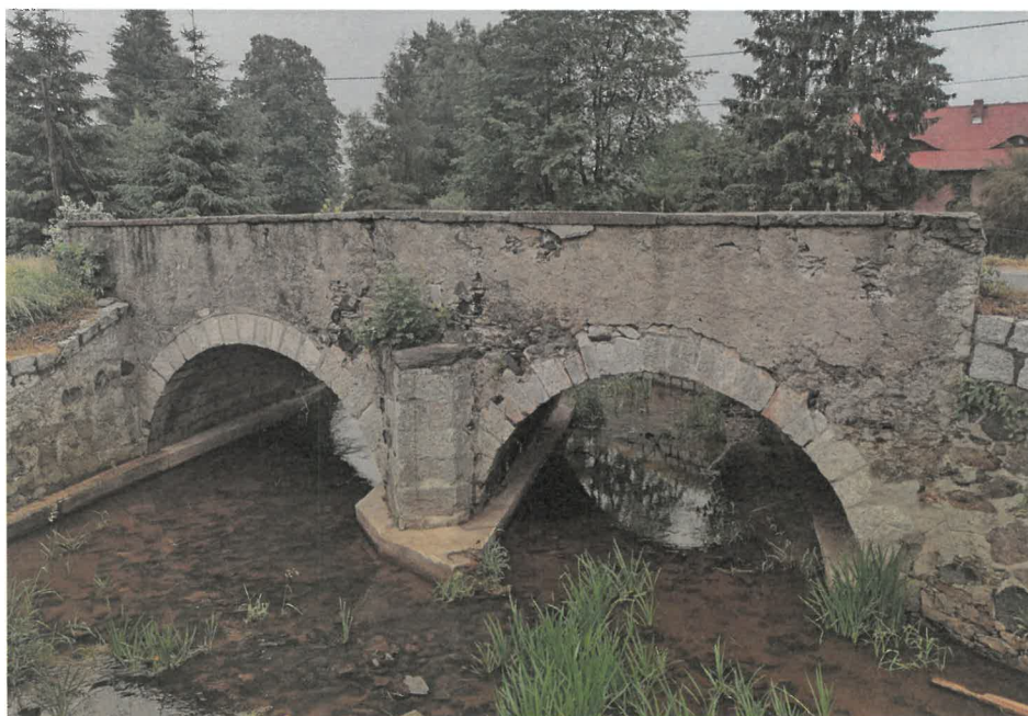
Widok od strony południowej