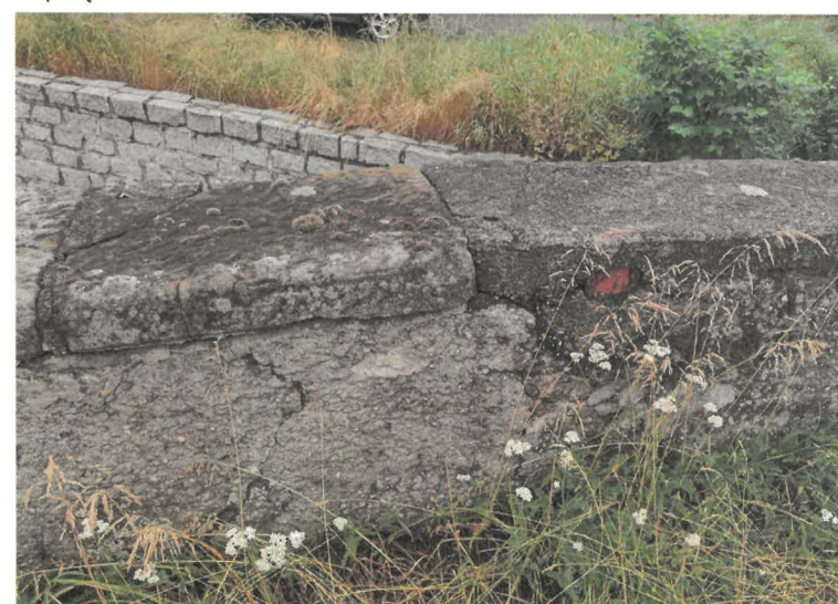
5. fragment kamiennej czapy balustrady