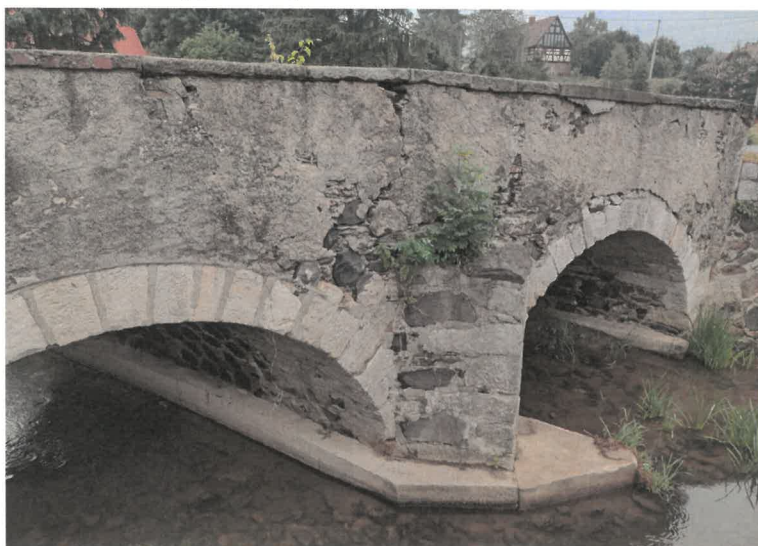
4. widok arkadowych prześel od strony południowej