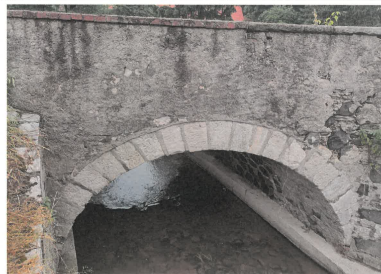
3. prześło zachodnie