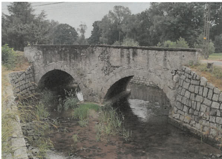
2. widok od strony północnej